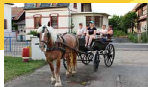
Lundi 9 juillet, le jury des Maisons fleuries a fait le tour du village en calèche. Ce fut l'occasion de noter et de photographier les réalisations qui mettent en valeur les habitations et le patrimoine de Muttersholtz.