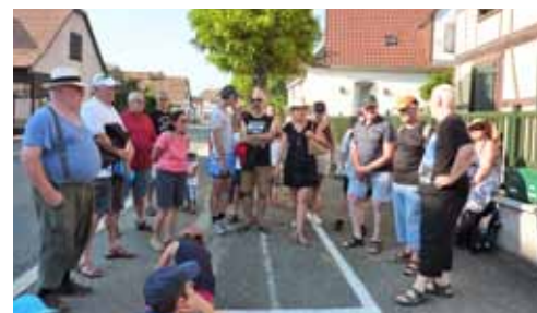
Les sorties Ried au pas des villageois ont permis, cet été, aux touristes et aux locaux, de suivre les explications, les histoires et les anecdotes d'habitants passionnés par leur village. Ces sorties sont organisées conjointement par la Maison de la nature et la Commune.