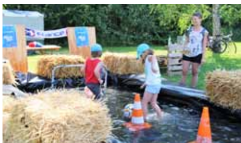
Dimanche 24 juin, les associations du Comité des Fêtes ont proposé la seconde édition de Muttersholtz Fescht, une fête de l'eau ludique et rafraîchissante, qui a rassemblé petits et grands autour de jeux drôles et variés.