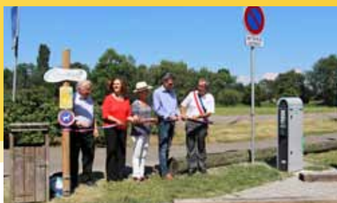
Lors de la Fête des énergies positives des 30 juin et 1er juillet, la Commune a inauguré ses principales réalisations en faveur des économies d'énergie : l'aire d'éco-mobilité, l'Ecole élémentaire, le Hibou pêcheur et le nouveau Gymnase.