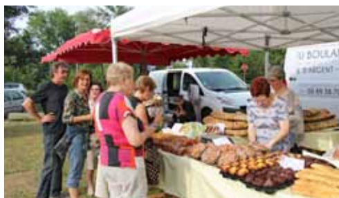
Vendredi 20 juillet, l'association Loisirs, Découvertes & Traditions a organisé un Marché du terroir qui a réuni plusieurs centaines de personnes sur la place des Fêtes, dans une ambiance conviviale.