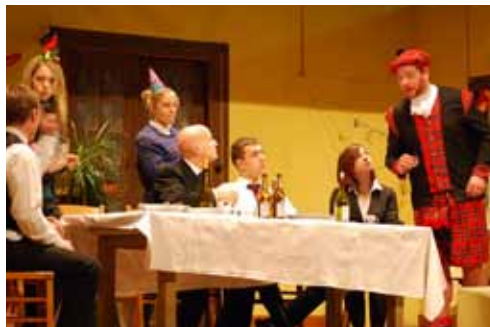
Les deux soirées de théâtre organisées par le Comité des fêtes ont connu un beau succès populaire. C'est un encouragement important pour les bénévoles organisateurs.