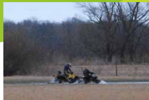
Mais il y a aussi des pratiques intolérables : ce type de vandalisme existe malheureusement. La Commune et la gendarmerie étudient les moyens de l'empêcher.