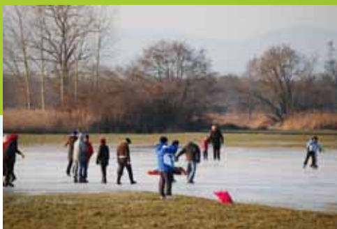
L'hiver et le froid réservent aussi des moments de grâce : le patinage sur les prés gelés du Ried en est un pour les jeunes et les moins jeunes.