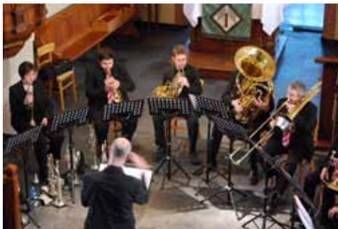
C'est dans l'église protestante que le Wonder Brass Ensemble formé de 10 musiciens a régalé une belle assemblée. Suite des festivités des 120 ans de la Musique Echo, les 9 et 10 juin.