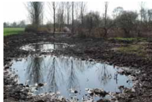
Les nouvelles mares sont creusées. Elles attirent déjà batraciens, libellules et oiseaux. La Maison de la nature organise le 5 mai une visite guidée à vélo.